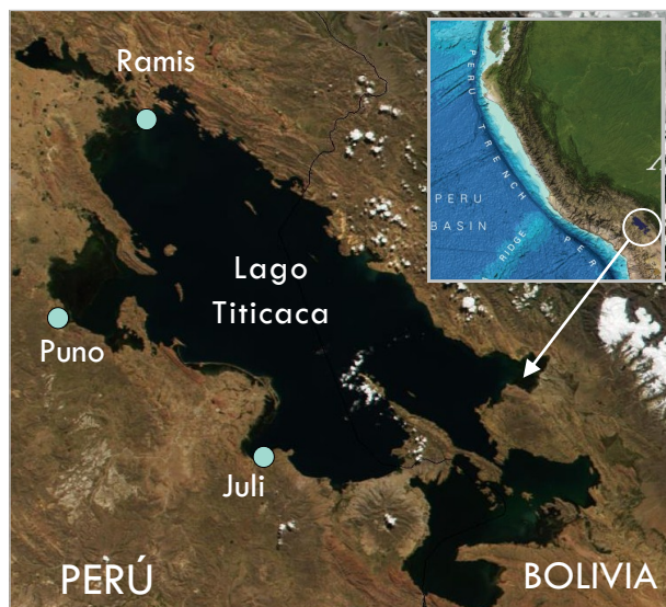
Figura 1. Localización de las estaciones limnológicas del IMARPE en el Lago Titicaca. Los mapas base y en el recuadro se adaptaron de NASA y de GEBCO (2014).

Este producto tiene el propósito de informar a la sociedad de las variaciones diarias de la temperatura superficial del agua en las estaciones limnológicas que administra el IMARPE en las localidades de Puno, Juli y Ramis.