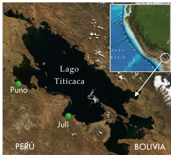
Figura 1. Localización de las estaciones limnológicas del IMARPE en el Lago Titicaca. Los mapas base y el recuadro se adaptaron de NASA y de GEBCO (2014).

Este producto tiene el propósito de informar a la sociedad de las variaciones diarias de la temperatura superficial del agua en las estaciones limnológicas que administra el IMARPE en las localidades de Puno y Juli, a orillas del Lago Titicaca (TSL). Asimismo, a partir de la fecha se está incluyendo el valor diario del nivel medio del Lago Titicaca (NML), dato provisto por la Sede Descentralizada de Puno del Servicio Nacional de Meteorología e Hidrología (SENAMHI).