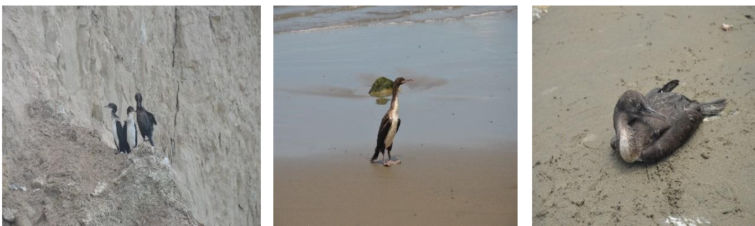
Ejemplares de guanay vivos encontrados en playa.