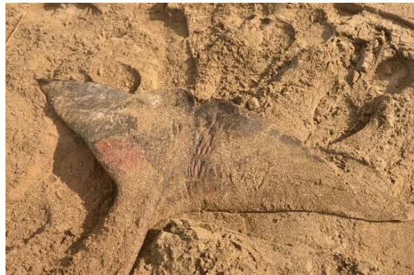
Delfín piloto Globicephala macrorhynchus , varada al sur de Los Tanque de Puerto Eten, 24 de marzo del 2017.