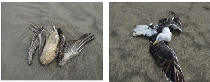
Ejemplares de pelícano y gaviota muertos encontrados en playa Gaviotas en Caleta San José.