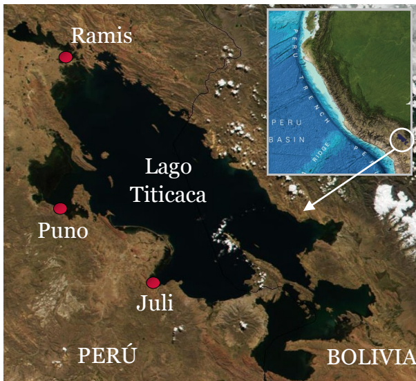
Figura 1. Localización de las estaciones limnológicas del IMARPE en el Lago Titicaca. Los mapas base y en el recuadro se adaptaron de NASA y de GEBCO (2014).

El Reporte Diario de la Temperatura Superficial del Agua en el Lago Titicaca es un producto de la Dirección General de Investigaciones Oceanográficas y Cambio Climático (DGIOCC) y del Laboratorio Descentralizado de Puno, ambos del Instituto del Mar del Perú (IMARPE). El Reporte tiene el propósito de informar a las sociedad de las variaciones diarias de la temperatura superficial del agua del lago Titicaca en las estaciones limnológicas que administra el IMARPE en las localidades de Puno, Juli y Ramis.